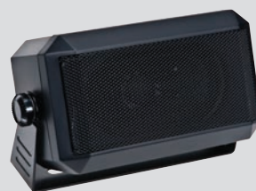
RSN4001 13 W Externer Lautsprecher